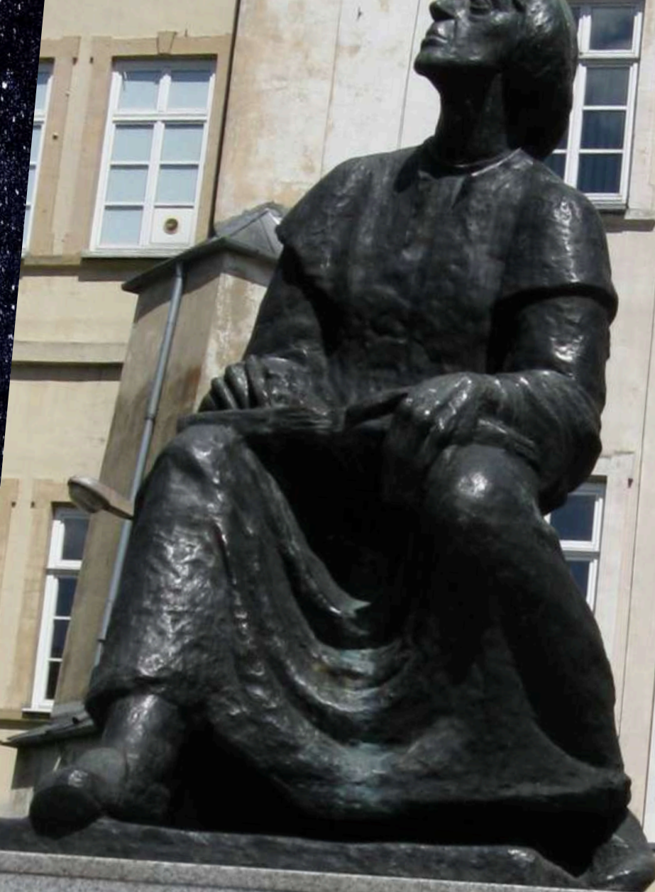
MIKOŁAJ KOPERNIK 1473 - 1543

W 1973 roku zorganizowano sesję naukową o Koperniku. Był to początek rozwoju pasji do astronomii w szkole.